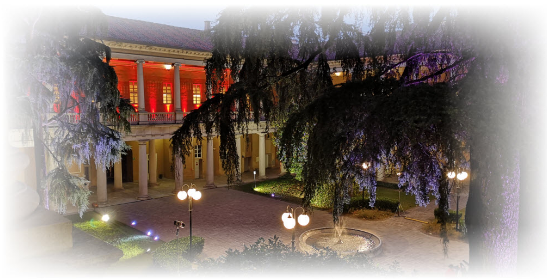
il cortile interno del Liceo con vista sull'ingresso e i bellissimi cedri del Libano

Frisi, ma nel caso dello Zucchi, per ragioni logistiche, il controllo su alunni e visitatori era più semplice. All'ora della entrata e della uscita veniva aperto il cancello in ferro di accesso al cortile e dal cortile si saliva al primo (e unico piano) attraverso i quattro scaloni posti ai quattro angoli. Nel resto della giornata si poteva salire solo passando dalla guardiola sulla destra dove una bidella provvedeva a segnalare gli arrivi via citofono. Di fianco alla guardiola si faceva il ricevimento dei genitori in un'aula abbastanza squallida e senza sala d'attesa (ma anche al Frisi era così).