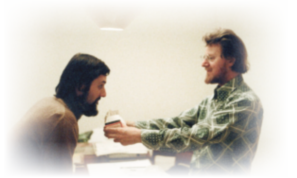
Bertlmann e Bell al CERN nel 1980

Oggi ho ripreso in mano l'articolo di Bell per festeggiare l'acquisto di "Modern Quantum Mechanics – from Quantum Mechanics to Entanglement and Quantum Information" di Bertlmann che utilizzerò per scrivere la parte finale del II capitolo di MQ. Lo pubblicherò nei prossimi giorni in attesa degli ultimi paragrafi (le prove sperimentali della violazione quantistica della località, le applicazioni dell'entanglement alla crittografia, al teletrasporto e alla informatica quantistica).